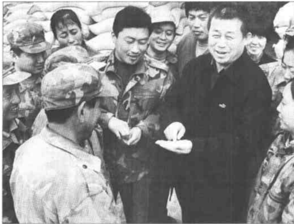
利津县鲁晶油料加工有限公司是由该县粮食系统78名下岗职工入股创建的。该公司严格按照现代化企业管理模式运作，强化内部管理，加大了营销力度，取得了良好的经济效益和社会效益。该公司两年来，不仅上交税金100余万元，还解决了100多名下岗工、待业青年的工作问题。

我们相信，只要我们在市委、市政府的正确领导下，全面贯彻“三个代表”重要思想，坚定信心，振奋精神，齐抓共管，群防群控，就一定能够夺取农村非典型肺炎防治和农村经济发展的全面胜利。