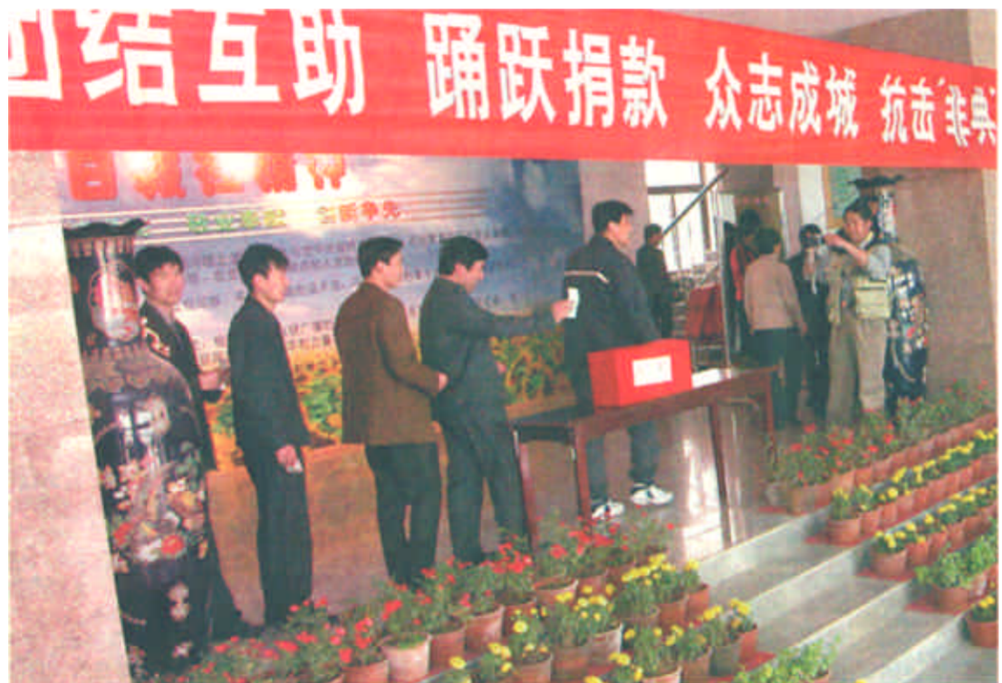
5月7日，东营日报社全体干部职工积极响应市委、市政府的号召，迅速行动起来，纷纷投身到防治“非典”这场没有硝烟的战争中去，踊跃为防治“非典”捐款，表达了团结互助的爱心，奉献出一片赤诚。（记者 延智 摄）

本报讯 日前，随着一间间村居倒塌，我市最大的“城中村”——辛镇村首期拆迁118户工程正式启动了，此举标志着辛镇村将要告别“城中村”的历史，融入到城市建设中来。为加快东西城对接，彻底解决“城中村”不适应城市化发展的要求，2002年，东营区政府建设新区时将辛镇村纳入了总体规划，分期分批拆迁，为村民们规划建设高标准住宅楼，2至3年建成后，让村民们真正过上城市居民的生活。（李冬梅）