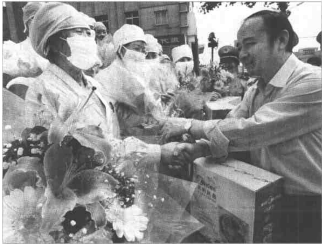
5月6日，北京崇外街道办事处领导将鲜花与20台电风扇送到北京普仁医院医护人员手中。北京崇外街道办事处通过捐款和集资方式购买了20台电风扇赠送给该院治疗的“非典”病人——普仁医院。以实际行动表达对白衣天使的崇高敬意。