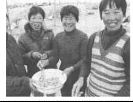
唯一的“业余文化生活”大概就是“甩老K”了。